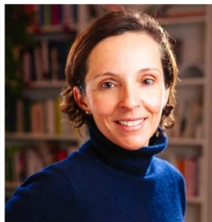
Abg.-NRin Martina Künsberg Sarre Bildungssprecherin NEOS