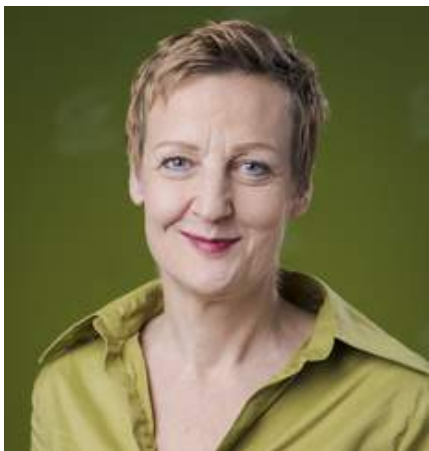
Abg.-NRin Maga Sibylle Hamann Bildungssprecherin Die Grünen