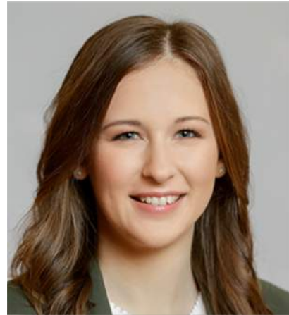
Claudia Plakolm Staatssekretärin „Jugend“ Bundeskanzleramt