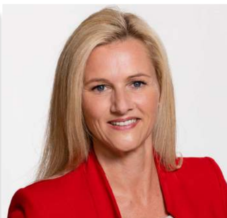
Abg.-NRin Petra Vorderwinkler Bildungssprecherin SPÖ